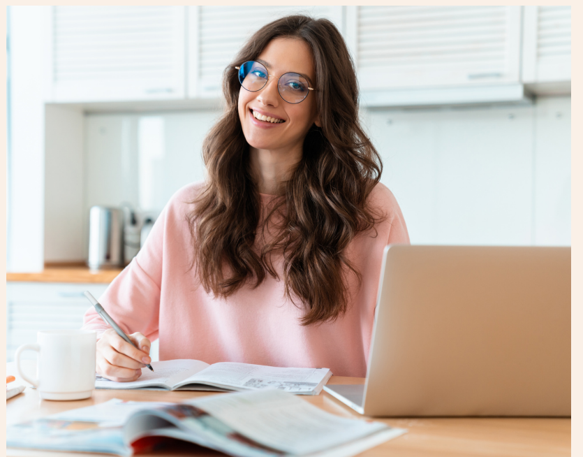
Talleres y cursos