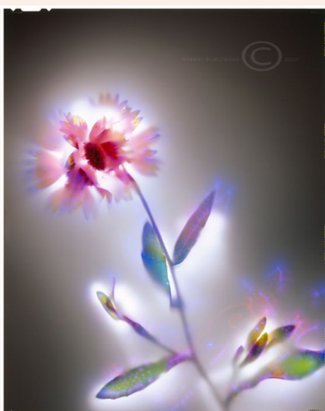
Foto Kirlian del campo energetico de una flor

Es un trabajo que se hace desde el alma.