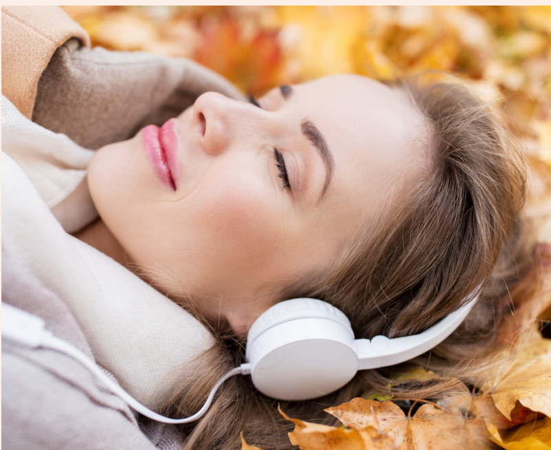
Terapia de frecuencias