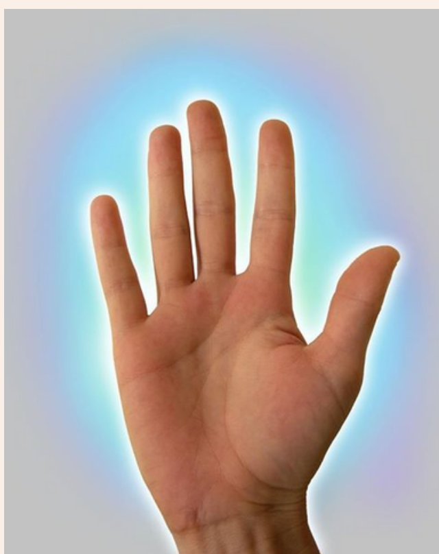
Foto Kirlian del campo energetico de la mano

Los seres humanos y todo lo que nos rodea en la naturaleza esta conformado por energia y vibración. Nuestro campo de vibración se ve afectado por nuestras emociones dando como resultado un desequilibrio energético, baja nuestro nivel vibratorio, nos sentimos agotados, tristes, con miedo, abatidos, frustrados, con insomnio..... Un abanico amplio de emociones que pueden llegar a enfermarnos o al menos a hacernos infelices.